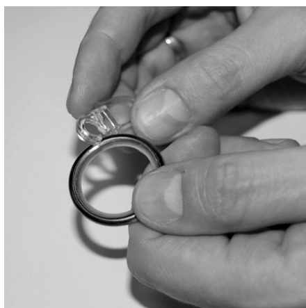
Вставить крючки на кольца