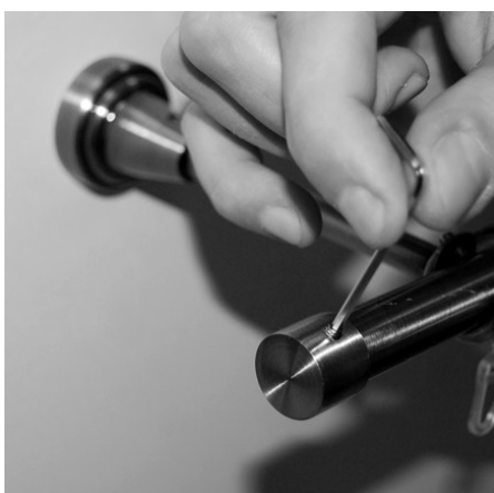
Установить заглушки на вторую штангу с помощью отвёртки-шестигранника