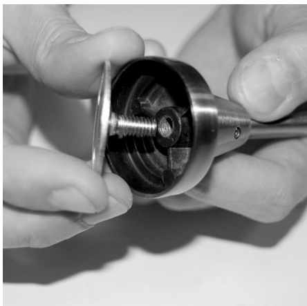
Раскрутить основание кронштейна