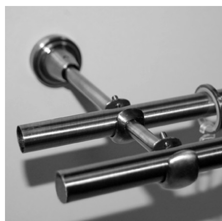
Установить штанги с кольцами на кронштейны