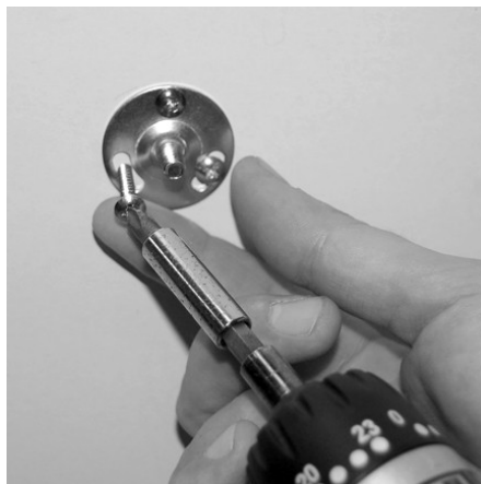
Установить основание кронштейна на стену