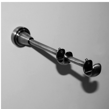
Установить второй кронштейн аналогичным способом (карниз 2,4 м и более — 3 кронштейна)