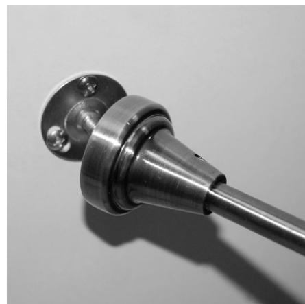
Прикрутить кронштейн на основание